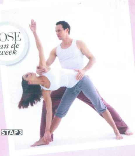
POSE van de week